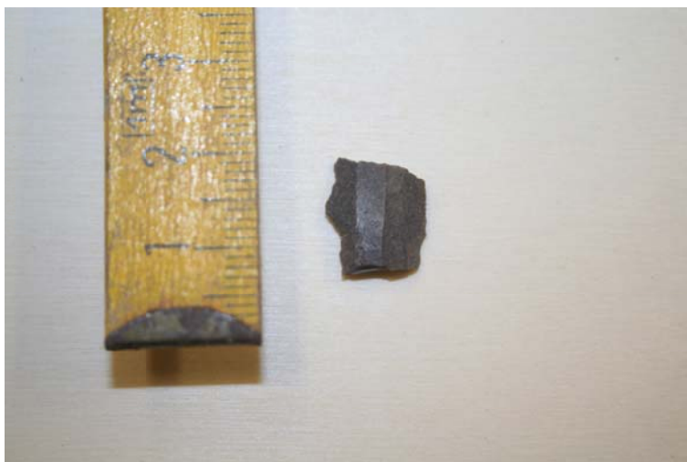
10. Irudia. Atxolin inguruan aurkitutako pieza