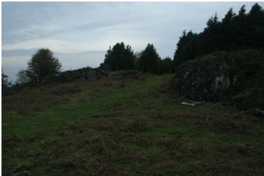
3. Irudia: azaleko miaketak

Ikusizko miaketak lur-azala agerian gelditu den lekuetan zentratu da, bereziki bidezidorretan eta basurdeek zotala irauli duten lekuetan. Jarduera honen helburua lur-azalean egon daitezkeen material arkeologikoa bilatzea da, eta aurkitutako piezen kokapena mapa topografikoetan seinالاتu egin da.