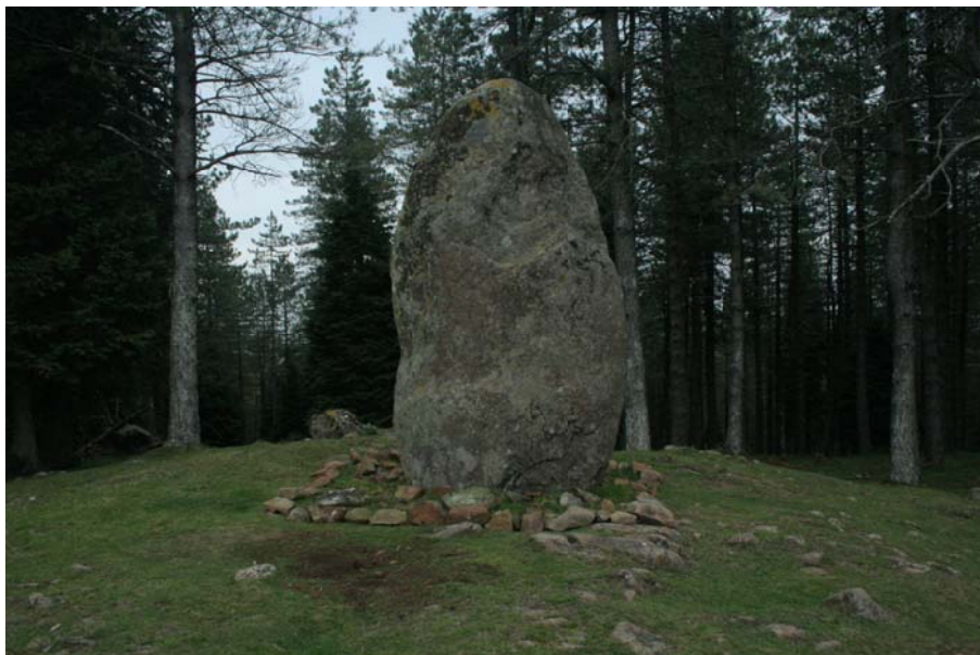
12. Irudia. Arribiribiletaren oinarria, konponketa egin ondoren

Garbiketak ez du inolako kalterik eragin monumentuen kontserbazioan. Arribiribiletari dagokionez, oinarriko morteroa babesteko goma eta zotalezko geruza jarri dugu.