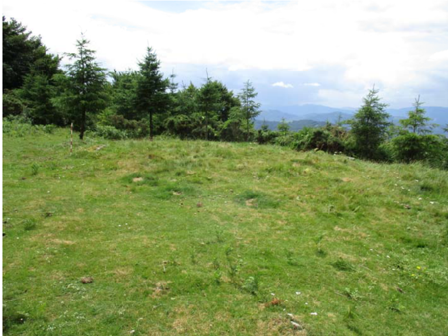
6. Irudia. Sabuako konkorra, sasiak garbitu ondoren