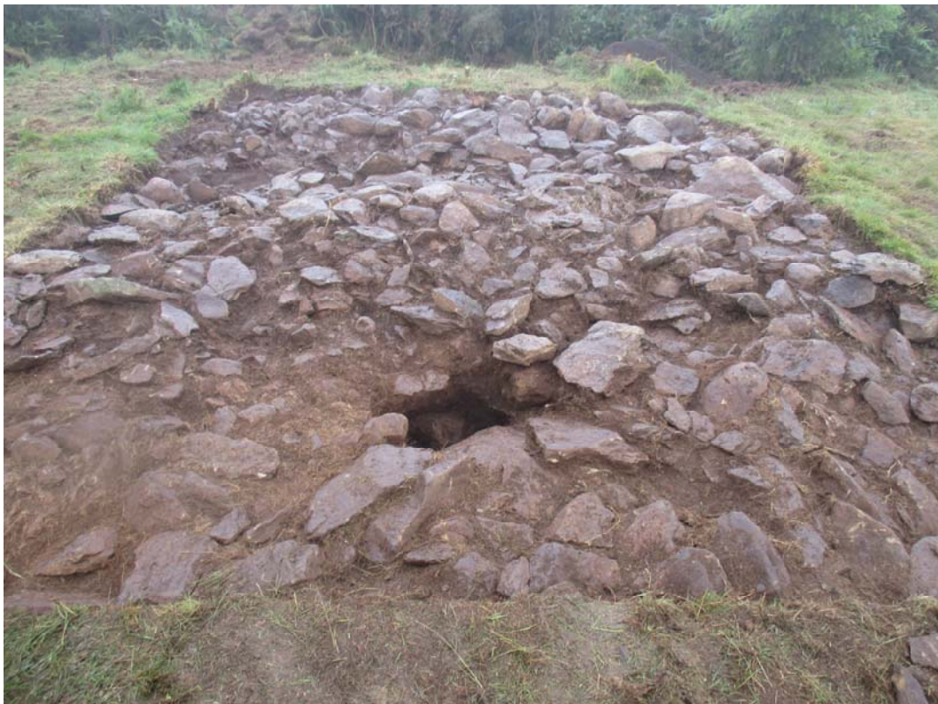
14. Irudia. Sabua tumulua