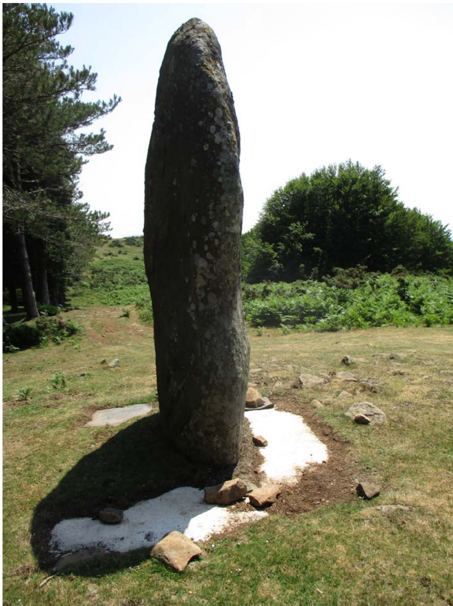
4. Irudia. Arribiribileta zutarriaren oinarria

Arribiribiletari dagokionez, zutarriaren oinarriko morteroa babesten duten goma eta zotala kenduta zeuden, eta beharrezkoa izan da goma berriz jartzea eta ondoren oinarria zotalaz estaltzea.