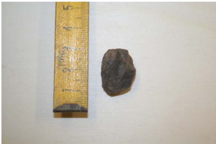
9. Irudia. Gizaburuagaren inguruan aurkitutako pieza