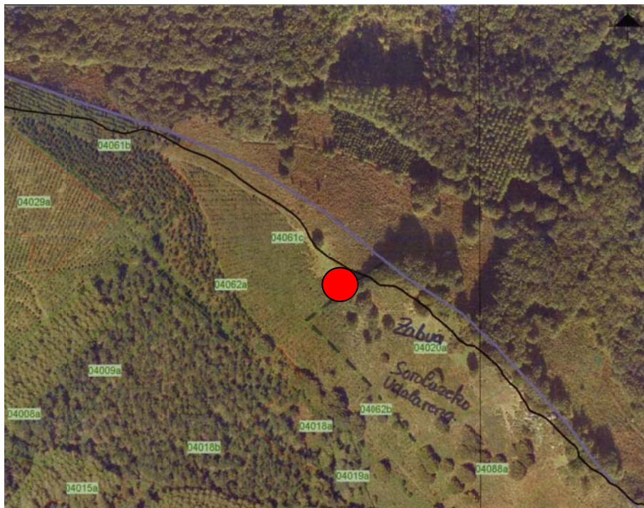
2. Irudia: Katen bidezko miaketa-eremuaren xehetasuna.