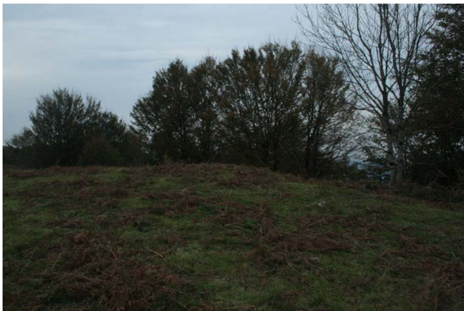
13. Irudia. Iruiyan aurkitutako ustezko tumulua

-Ustezko tumulu berria. Iruiyako zelaian, borda baten ondoan konkor bat ikus daiteke. Konkorrak ebakidura erdizirkularra eta diametroan 6 m-ko oinplano borobila dauka.