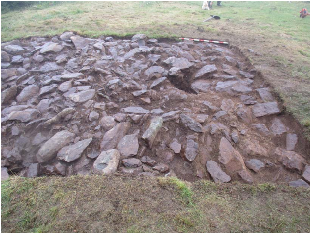
15. Irudia. Sabua tumulua

Tumulua basalto-azaleratzea estaltzen duen lurrazalaren gainean eraiki zela argi ikusten da estratigrafia eta tumuluaren harriak aztertuz gero. Azaleratzearen gainean humus geruza bat osatu zen tumulua eraiki aurretik, eta ondoren egin zen harrizko egitura antolaketa zentrokide bat jarraituz.