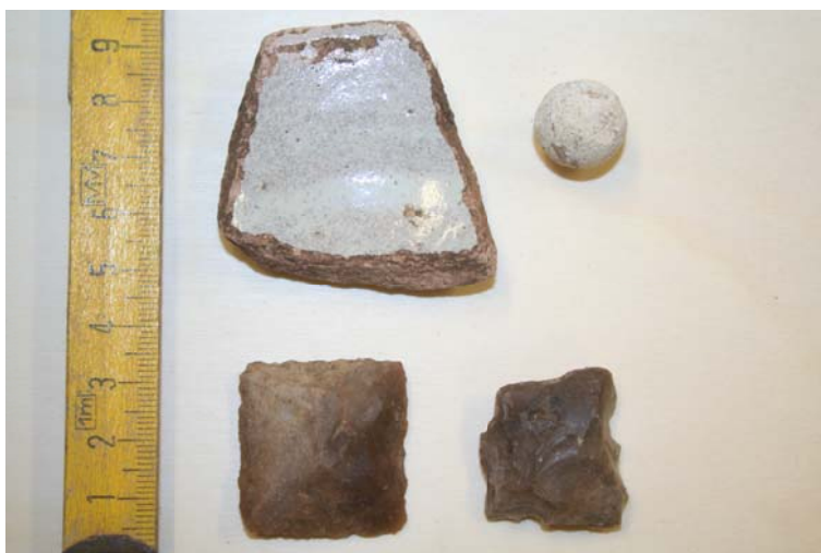
11. Irudia. Irukurtzetaren inguruan aurkitutako piezak