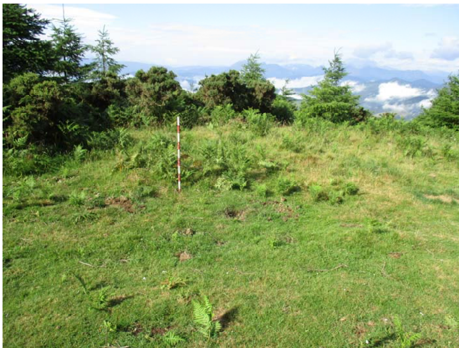
5. Irudia. Sabuako konkorra, sasiak garbitu aurretik

Horretarako konkor gaineko sasiak, otea eta garoa garbitu dira, eta ondoren katen indusketa hasi da.