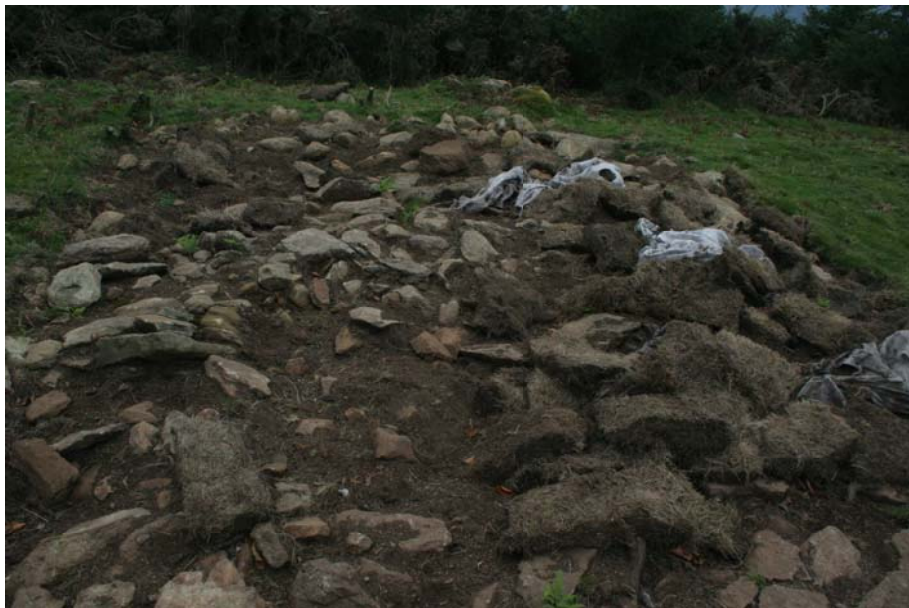
7. Irudia. Sabuako tumulua, zotala eta geotextil-ehuna kenduta