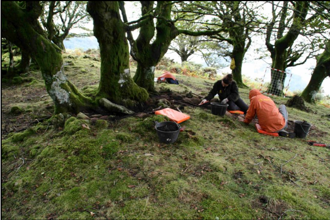
Atxolin txiki II. Lanak.