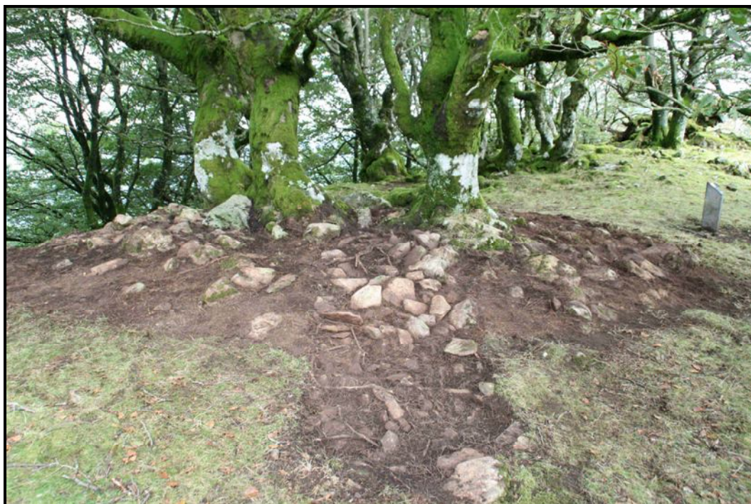
Atxolin txiki II bukaeran.