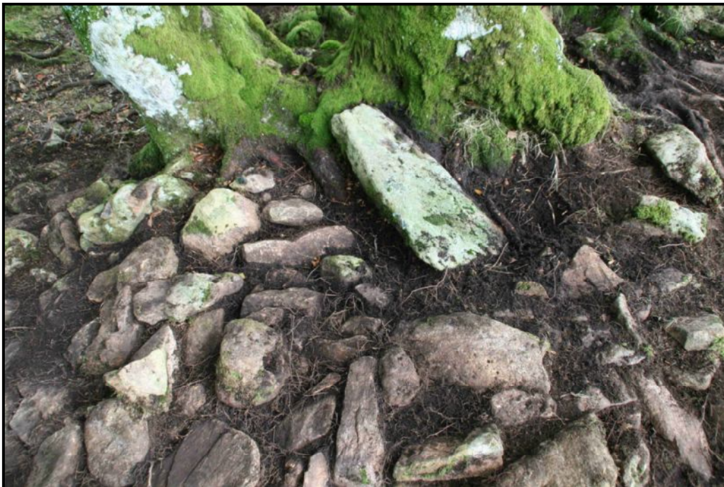
Atxolin txiki II. Ganbararen arlauz bat.