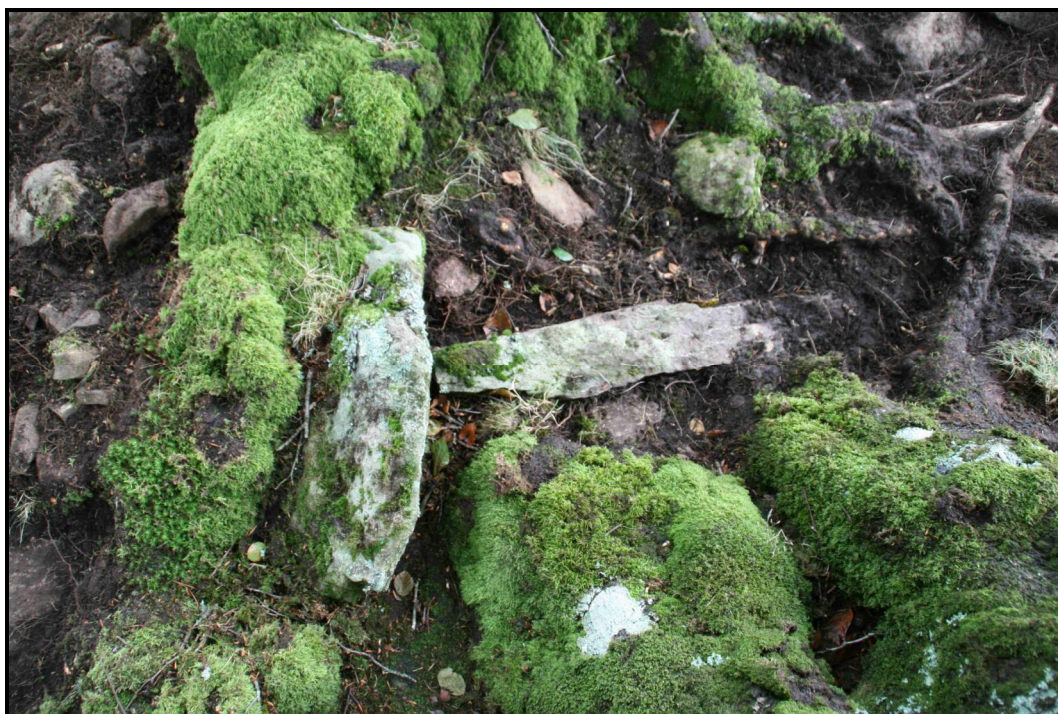
Atxolin txiki II. Ganbararen aztarnak.