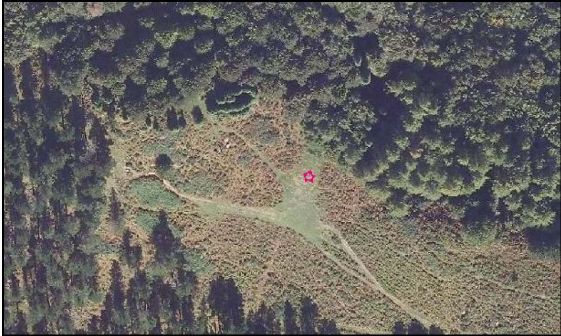
Gizaburua tumulua eta mendebaldean "dolmenak".