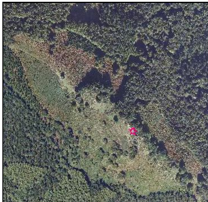
Atxolin Txiki II. Kokapena.