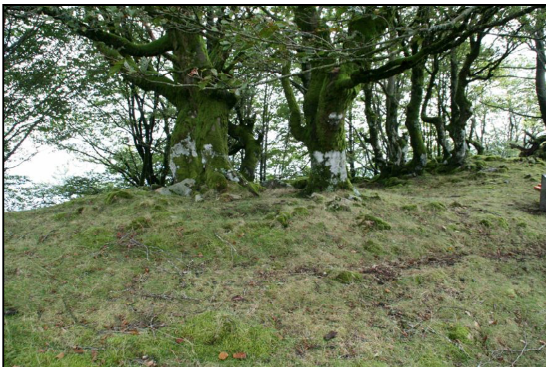
Atxolin Txiki II hasieran.

Esku-hartzearen bidez identifikatu dugu bertako basaltz egindako tumulua, 5 eta 6 metro arteko diametroa eta gehienez metro erdiko altuera duena. Ganbara txiki baten aztarnak ere baditu, nahiz eta pago batek hartua egon. Hala ere, jatorrizko lekuan dauden bi harlauza baino ez dira ikusten hego-ekialdeko erpina osatzen. Beste pago bat ere badago tumulu gainean, ganbararen hego-ekialdean. Tumuluaren mendebaldeko zatiaren gainean beste harlauza bat datza.