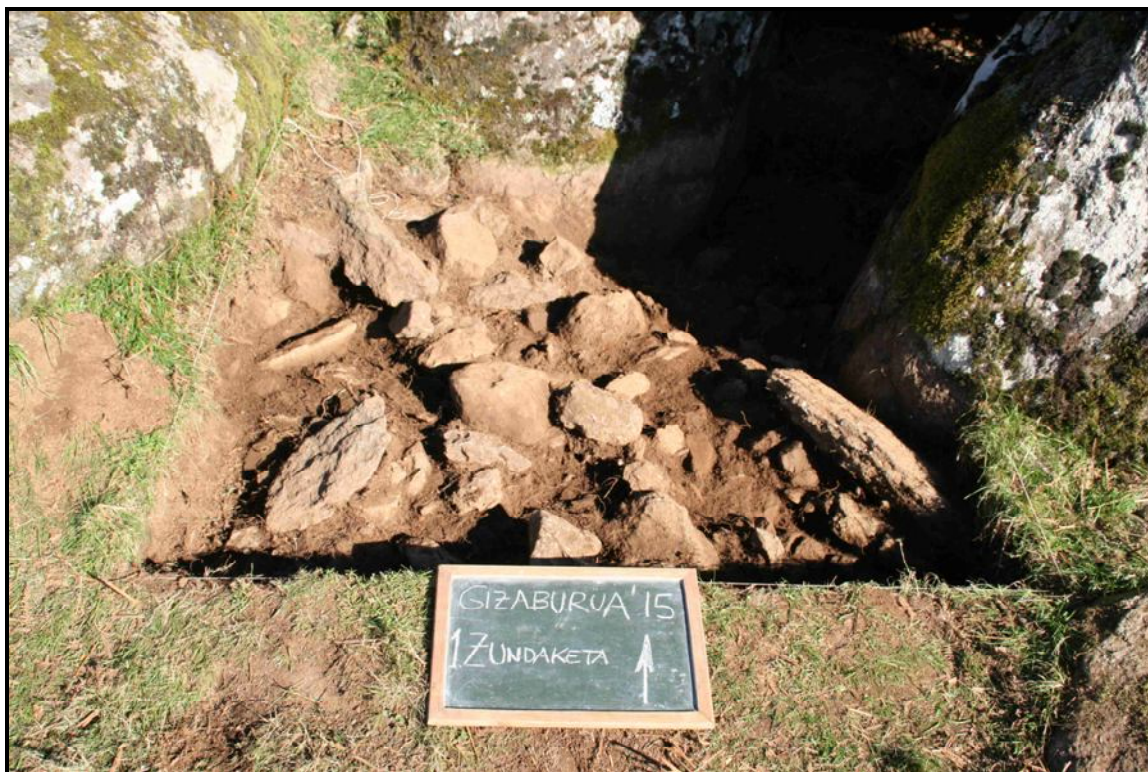
"Dolmenak". Zundaketa bukatuta.